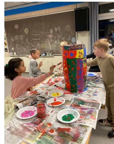
Klargøring til fastelavn

Vil DU have noget med i næste nummer af Luppen, der udkommer sidste mødeaften i marts, SKAL det afleveres senest den 10. Marts 2023