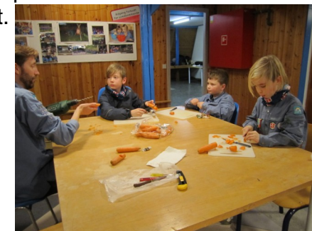
LUPPEN - FDF Thisted 1