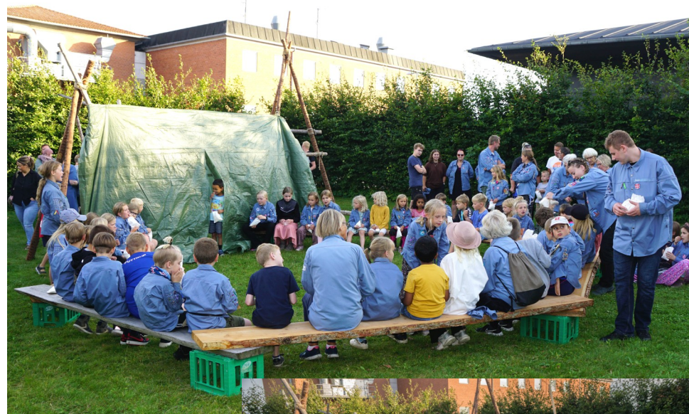
Der var både 6 benede heste, og en slange tæmmer med i cirkus