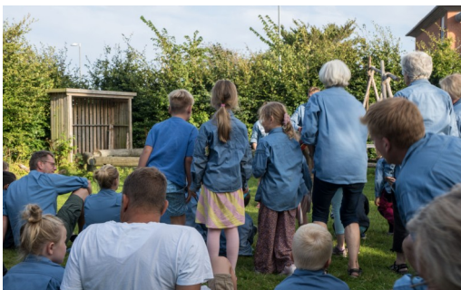
“Her er de store .....”