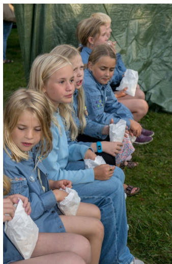
Popcorn før forestillingen