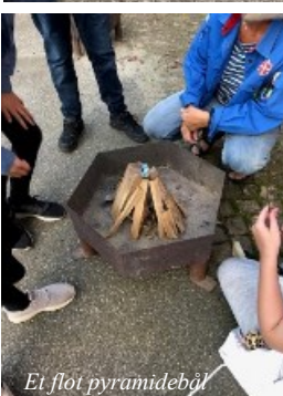
Et flot pyramidebål