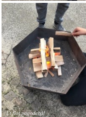
Et flot pagodebål