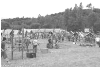
Seniorcity 2005 på Sletten.