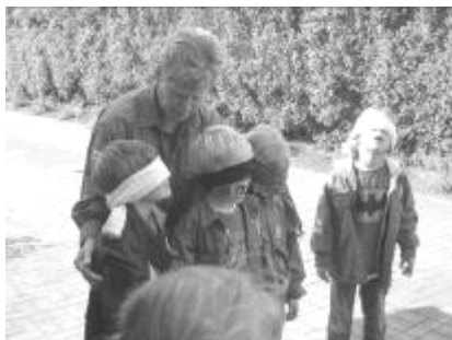
24.05 Puslinge på byløb.