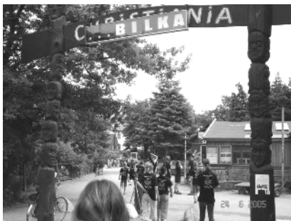
Sommerlejr 2005: Besøg i Christiania.

Der tages forbehold for trykfejl og udsolgte varer!