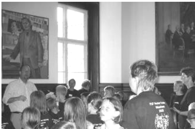
Sommerlejr 2005, København: Besøg i Folketinget