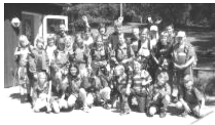
Hike - Sommerlejr 2005