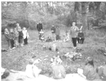
Tumlingeaften i Myrebo Juni 2005