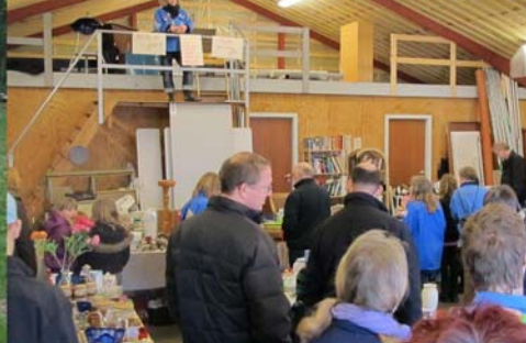
Sommerlejr, kanotur og loppemarked