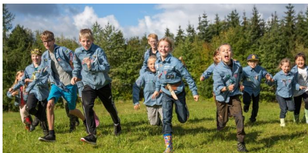
Flyt jer... FDF kommer stormende